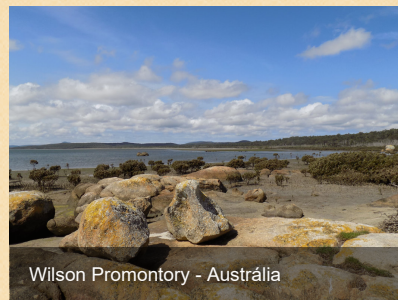
Wilson Promontory - Austrália

Praias paradisíacas de Cancún, ruínas maias de Chitzén Itza, cidade histórica de Valladolid e descanso na ilha Holbox.