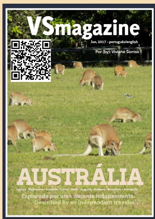
Revista VS Magazine, online, gratuita. Clique na imagem e divirta-se.

A Austrália é linda e os australianos simpáticos. Difícil não se apaixonar.