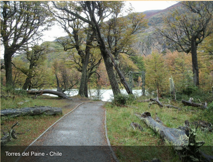
Torres del Paine - Chile