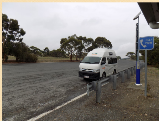
Viajando via RELOCATION CAR pela Austrália. Clique na foto e saiba mais...