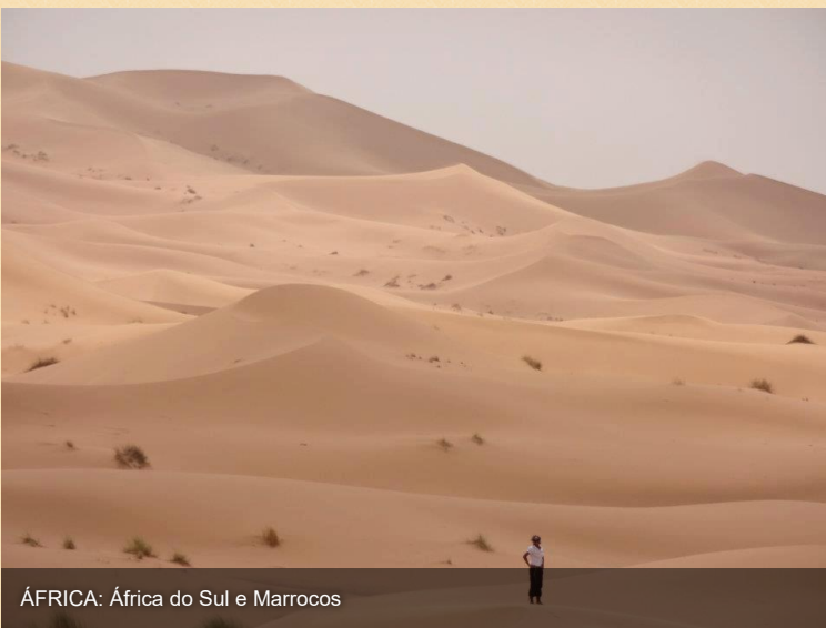
ÁFRICA: África do Sul e Marrocos